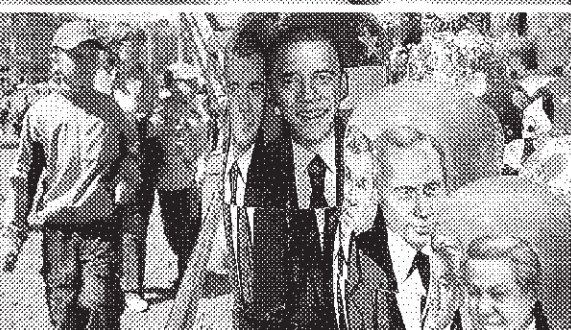
大仏さん、受験生、「マトリョーシカ」…日本に渡るマトリョーシカだ。セモノフ、副島英樹。オバマ米大統領がロシアを訪問した7月、モスクワの市場には歴代の両国指導者のマトリョーシカが並んだ。

カヤ・ロース(セモノフ)がある。20近い女性職人が大小様々な形に黙々と筆で模様を描き入れていた。コロコト社長(42)は「こんな小さな会社を支える必要性が国は考えていないでしょう」と言っている。続けて「つわさは